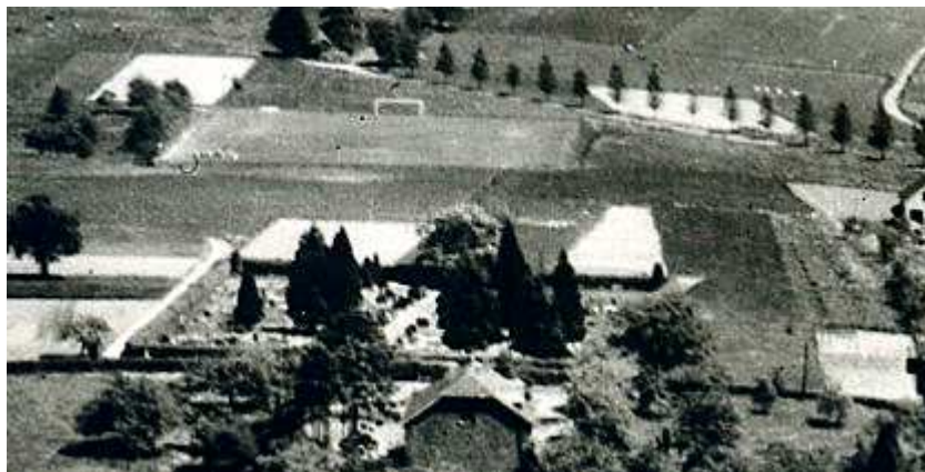
Winterscheid um 1959)